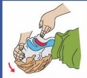
Uvoľni dýchacie cesty