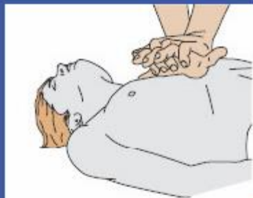
Stlačenie hrudníka 30x : Vdychy 2x